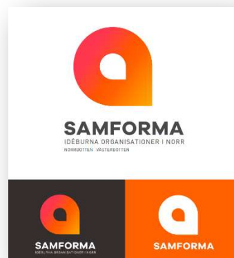
Ny grafisk profil

SEÖN ändrades till Samforma och fick samtidigt ny logga och modern grafisk profil. På grund av pandemin blev lanseringen i avsevärt enklare format än vad styrelsen från börjat hade önskat. Den web-blogg/hemsida som tidigare fanns ersattes under hösten av ny websida och ny Facebook-sida. SEÖN:s tidigare Facebookgrupp ändrades till "Samtalsforum för stärkt idéburen sektor i norr!" Facebooksidan hade ca 160 gillar-markeringar och gruppen 230 medlemmar.